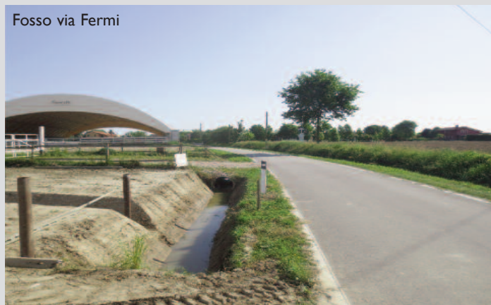
Fosso via Fermi

bianche in modo da garantire il deflusso dell'acqua e limitare eventuali danni. Come già avvenuto lo scorso anno il Comune da parte sua sta procedendo al risezionamento di alcuni fossi (vedi foto fossi via Fermi (foto n. 1 e foto n. 2) e via Mestrina (Foto n. 4 e Foto n. 5) ove il comune ha collaborato rispettivamente con i privati frontisti e Veneto Strade) ma per garantire il buon funzionamento della rete è necessaria anche la collaborazione dei privati che dovrebbero attenersi al rispetto di quanto stabilito dai regolamenti comunali. L'espurgo di fossi e canali è normata dall'articolo 21 del vigente regolamento di polizia rurale che individua i