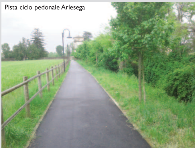
Pista ciclo pedonale Arlesega

bianche in modo da garantire il deflusso dell'acqua e limitare eventuali danni. Come già avvenuto lo scorso anno il Comune da parte sua sta procedendo al risezionamento di alcuni fossi (vedi foto fossi via Fermi (foto n. 1 e foto n. 2) e via Mestrina (Foto n. 4 e Foto n. 5) ove il comune ha collaborato rispettivamente con i privati frontisti e Veneto Strade) ma per garantire il buon funzionamento della rete è necessaria anche la collaborazione dei privati che dovrebbero attenersi al rispetto di quanto stabilito dai regolamenti comunali. L'espurgo di fossi e canali è normata dall'articolo 21 del vigente regolamento di polizia rurale che individua i