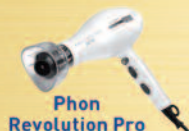
Phon Revolution Pro