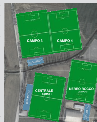
IMPIANTO COMUNALE CALCIO FRANCESCO BERTOCCHI Numero 4 campi omologati e illuminati con spogliatoio annesso indipendente.

Questo campo non sarà solo dedicato alla attività calcistica delle Associazioni sportive ma anche a libero accesso (controllato e programmato) dei ragazzi e/o pubblico generico, famiglie, gruppi.