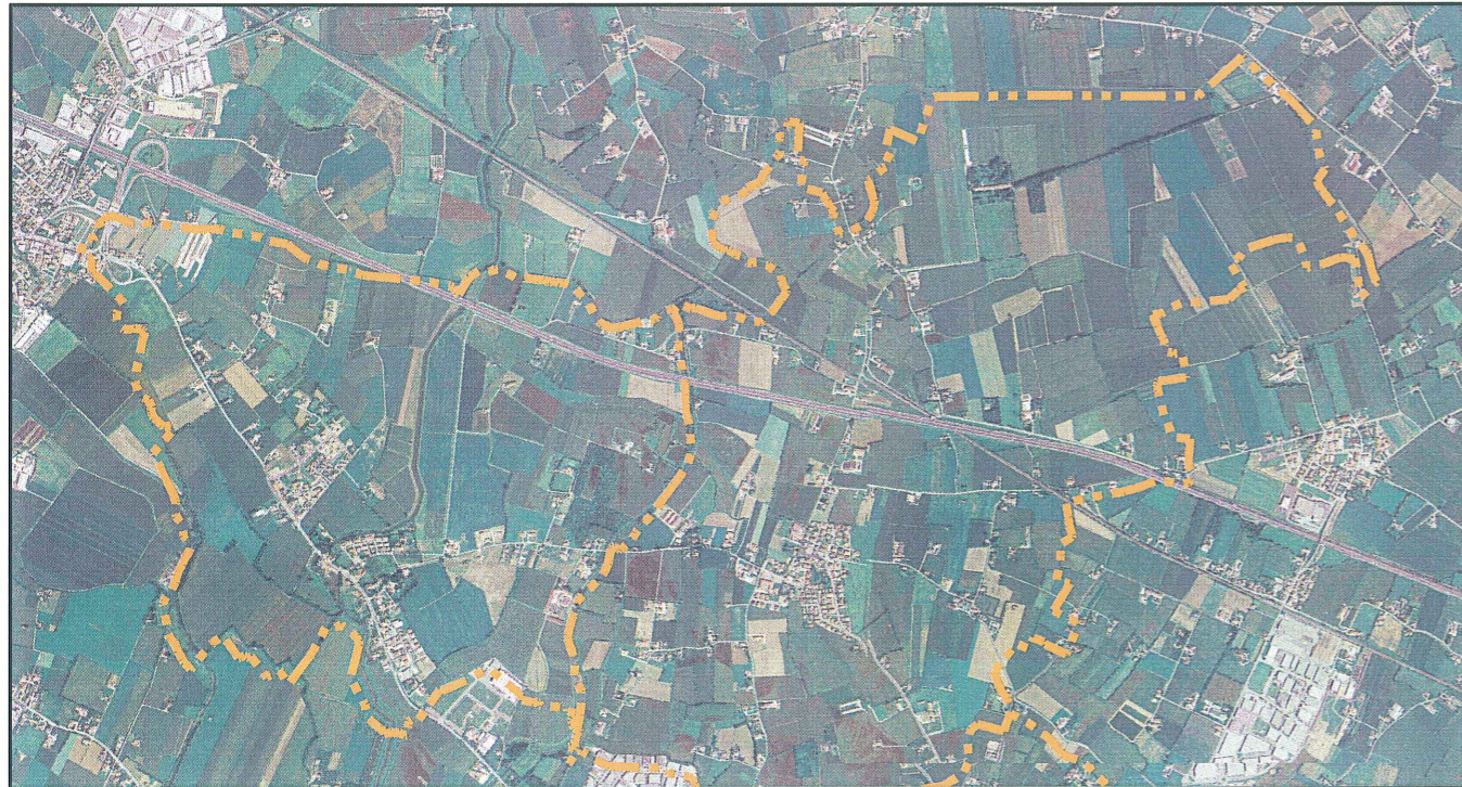
ORTOFOTOPIANO CON INDICAZIONE DELL'AREA OGGETTO DELLA PROPOSTA DI ACCORDO

PROPOSTA DI ACCORDO PUBBLICO - PRIVATO AI SENSI DELL'ART. 6 DELLA L.R. 11/04 IN ATTUAZIONE DELL'ART. 6 DELLE N.T. DEL P.A.T.